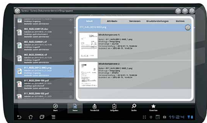
Auch unterwegs stets auf aktuelle Dokumente zugreifen